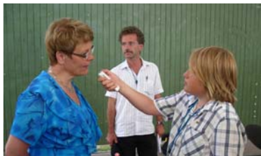
Centerpartiet, Maud Olofsson Lördag den 8 juli

Ja, jag vet inte riktigt, det där är nog inte staten som bestämmer utan det är kommuner och landsting. På sina håll har det nog varit så att om man har ett medicinskt synfel så kunde man få bidrag. Det där får vi titta på om det är en stor kostnad för vissa familjer så är det synd om de inte kan skaffa bra glasögon. Ingen ska ju behöva vara utestängd från skolundervisningen och inte kunna läsa för att man inte har bra glasögon.