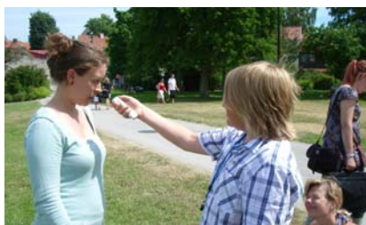
Miljöpartiet, Maria Wetterstrand Tisdag den 4 juli

Det är någonting som jag kan förstå att man kan uppleva som orättvist. Jag kan inte lova så här direkt vad jag ska förändra för jag vet inte vad det kostar och vad man i så fall skulle behöva ta dom pengarna ifrån.