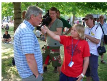
Vänsterpartiet, Lars Ohly Torsdag den 6 juli

Vi har inget sådant förslag men du beskriver problemet korrekt. I Sverige har öron varit offentlig sektor och ögon privat sektor. Jag tror väldigt få tycker det här med glasögon och hjälp med synen är ett problem utan kritiken kommer oftast när man behöver hjälp med hörseln. Det är då vi tycker oss ha problem med att få de hjälpmedel vi tycker oss ha rätt till och det är då det är långa köer. Därför är det runt hörseln vi behöver mer resurser.