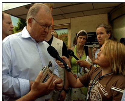
Socialdemokraterna, Göran Persson Söndag den 2 juli

Tycker du att alla barn som behöver glasögon ska kunna få bidrag till det?