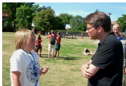
Kristdemokraterna, Göran Hägglund Måndag den 3 juli

Jag tycker inte att det är orimligt men det är inte jag som ska avgöra den saken. Det gör våra landsting och vissa landsting ger bidrag, men inte till vilka bågar som helst. En del bågar är väldigt dyra, men standardbågar och glaset. En del landsting ger inget och stöd och jag tycker att de ska pröva den saken särskilt. Vi kommer inte att gå in från statens sida och kräva att man ger bidrag rakt över utan landstingen bestämmer. Men landstingen har återigen en god ekonomi och det är en relativt begränsad kostnad.