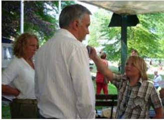
Folkpartiet, Lars Leijonborg Fredag den 7 juli

Ja, jag vet inte riktigt, det där är nog inte staten som bestämmer utan det är kommuner och landsting. På sina håll har det nog varit så att om man har ett medicinskt synfel så kunde man få bidrag. Det där får vi titta på om det är en stor kostnad för vissa familjer så är det synd om de inte kan skaffa bra glasögon. Ingen ska ju behöva vara utestängd från skolundervisningen och inte kunna läsa för att man inte har bra glasögon.